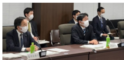
アドバイザリーボード(コロナ専門家会合)

感染拡大の防止には、国民の一人お一人に引き続きマスク着用や手洗い、うがい、三密の回避などの対策を徹底していただくほかありません。今後も気を緩めることなくご対応いただきますよう、心からお願い申し上げます。