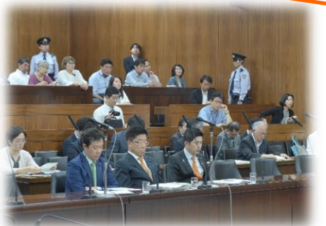
神妙な加藤厚労大臣