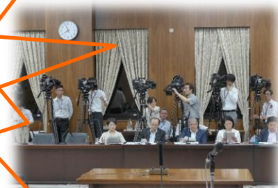
マスコミもあふれています

与野党協議を粘り強く重ね、やっと採決にたどり着きました。成立して終わりではなく、現場に即した法律となるよう今後もしっかりと見守っていきます。