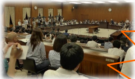
満杯の傍聴席から