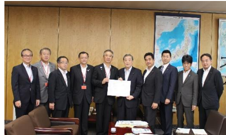
奥野信亮総務副大臣へ

相模川及び酒匂川流域下水道事業連絡協議会の皆様と、下水道事業を継続するための予算について要望活動を行いました。下水道施設はやがて一斉に耐用年数を迎えます。老朽化した施設の改築に必要な予算(国庫補助)の確保は、国民、県民の皆様の安全で衛生的な暮らしを維持するために絶対不可欠です。県議会議員団と共に事前に県から説明を受けるなど準備を重ね、必要性の認識を同じくして財務省、国交省、総務省へ赴きました。同行したのは衆議院の坂井学国政連絡会長、流域下水道管内選出の義家弘介議員、あかま二郎議員、牧島かれん議員。今後も皆様のよりよい暮らしのために、神奈川県と国政・県政が連携するこのような活動を重ねて参る所存です。