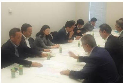
7月9日 事前の勉強・打合せ会

かながわ自民党の国政連絡会事務局長を務めています。国政と県政の連携を図り、国民、県民の皆様の暮らしの向上に向けて様々な課題に取り組んでいます。