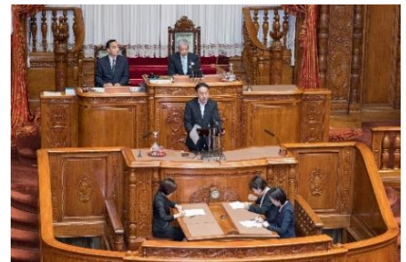
6月29日 参議院本会議で厚生労働委員会の審議経過を報告

会期終盤、続いて参院選挙制度改革に関する「改正公職選挙法」、統合型リゾート (IR) を整備するための「特定複合観光施設区域整備法 (IR実施法)」といった重要法案が続々成立しました。